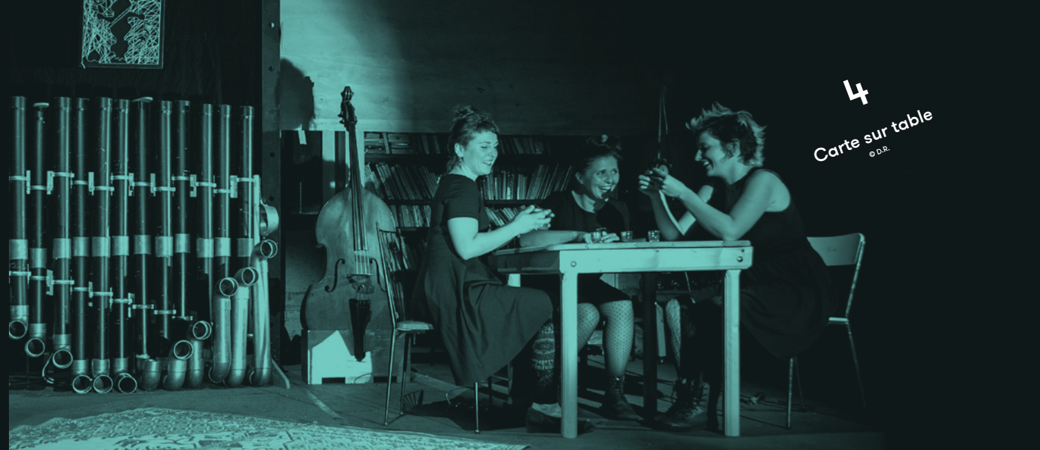
4 Carte sur table