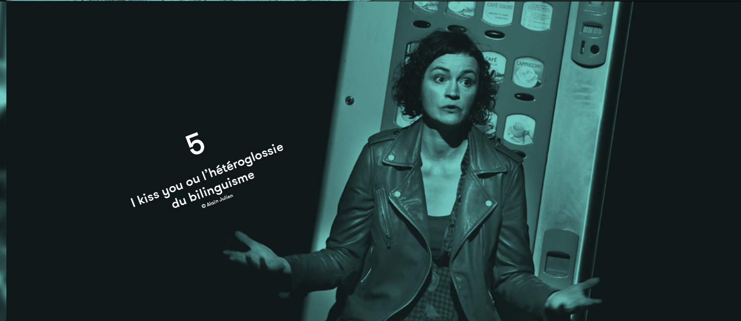
5 I kiss you ou l'hétéroglossie du bilinguisme © Alain Julien