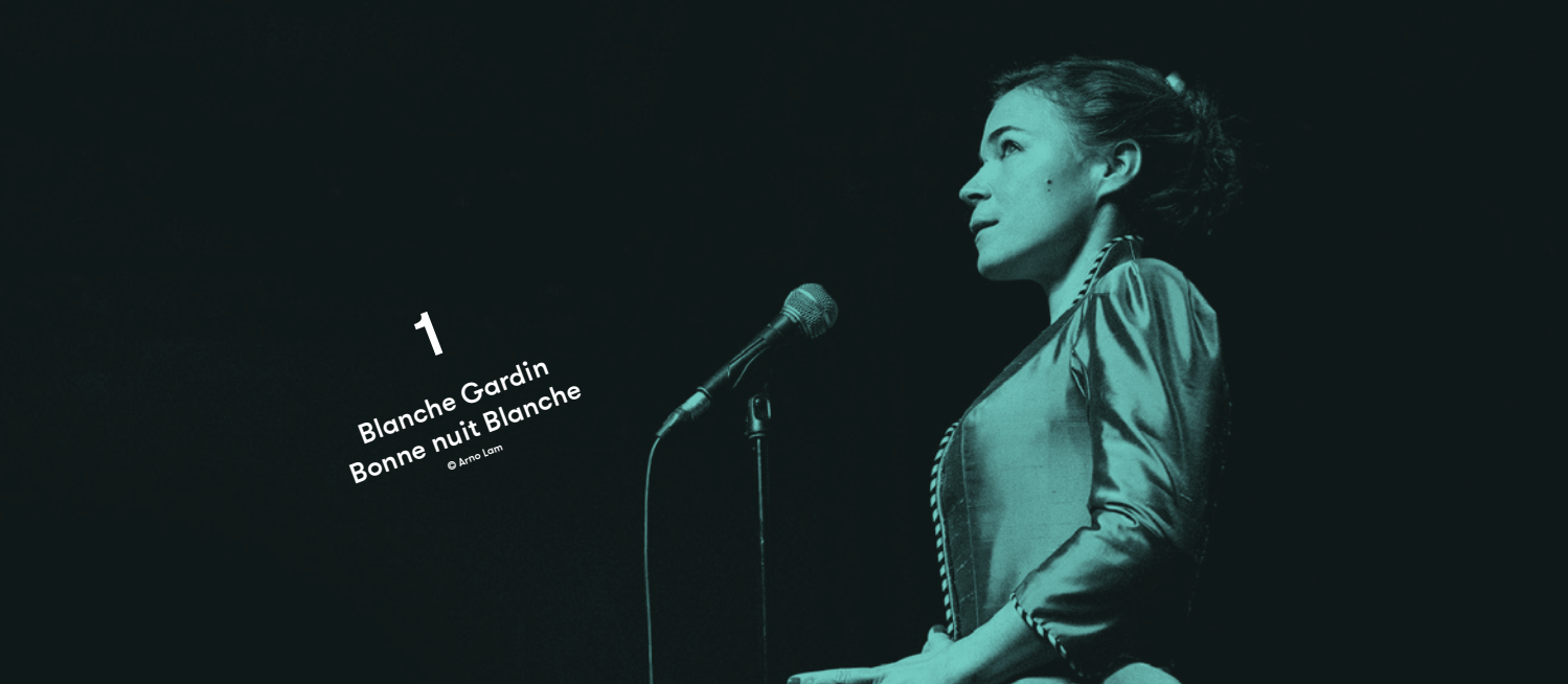
1 Blanche Gardin Bonne nuit Blanche © Arno Lam