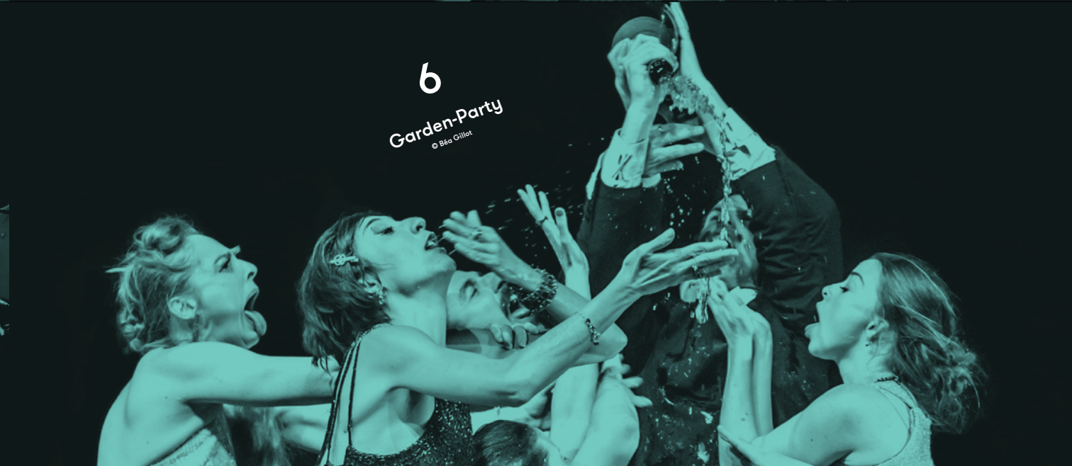
6 Garden-Party